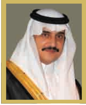
صاحب السمو الملكي الأمير محمد بن فهد بن عبدالعزيز